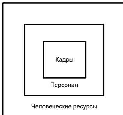
Рис. 1. Соотношение базовых (исходных) категорий HR-менеджмента

2. Каковы основные причины игнорирования персональных интересов работников в Российской Федерации? Ведь не секрет, что руководителей, для которых «незаменимых работников не бывает», гораздо больше, чем «персоналистов», стремящихся видеть в каждом работнике Личность.