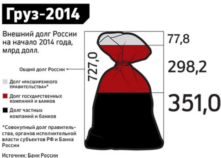
Рис. 3. Структура внешнего долга Российской Федерации (по состоянию на 2014 год) 7

Оптимистический прогноз развития страны, как правило, увязывали с неуклонным ростом объема золотовалютных резервов (рис. 2). За снижением ЗВР в 2009 г. до отметки 380 млрд. долл. последовало их восстановление в 2010 – 2013 гг. до уровней 450 – 540 млрд. и очередное падение в 2015 г. до 350 млрд. Пессимистический сценарий социально-экономического развития России связывают с гигантской задолженностью российских корпораций и банков. Если началу 2008 г. она составляла 413 млрд. долл. США, то в 2012 – 2014 гг. превышала 600 млрд. долл. США, а на 1 октября 2015 года составила 494 млрд. долл. 6 Более наглядное представление о ситуации даёт следующий рисунок: