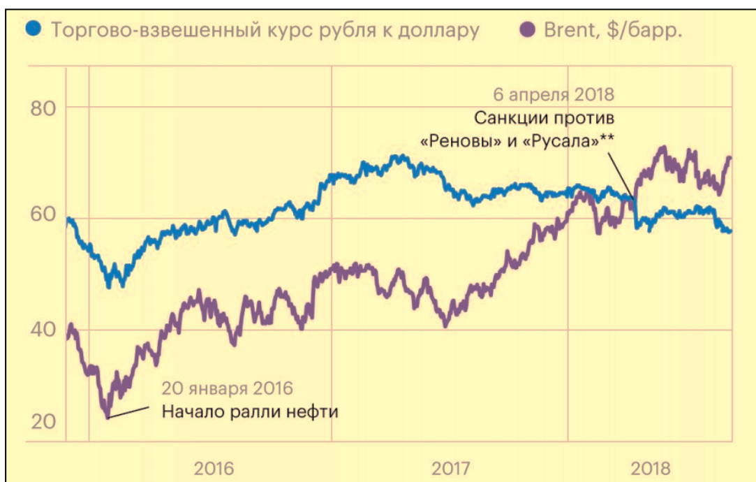
Рисунок 2 - Динамика курса рубля и цен на нефть марки Brent, 2016-2018 (Источники: Bloomberg; РБК 2 )

В качестве иллюстративного материала в работах часто используются графики. График целесообразно использовать для характеристики и прогнозирования динамики непрерывно меняющегося показателя при наличии функциональной связи между фактором и показателем. Оси абсцисс и ординат должны иметь условные обозначения и размерность применяемых величин. Надписи, относящиеся к кривым и точкам, производят только в тех случаях, когда их немного и они кратки. Многословные надписи заменяют цифрами, расшифровка которых приводится в пояснительных данных. На одном графике не следует приводить больше трёх кривых.