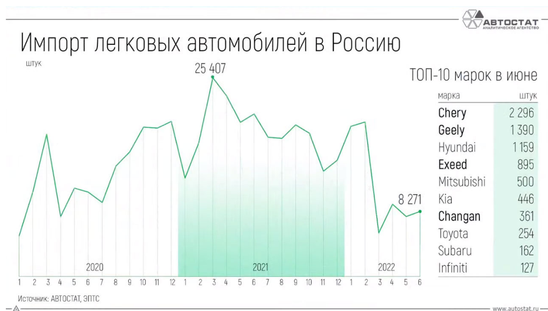
Рис. 2 – Импорт легковых автомобилей в Россию

В качестве иллюстративного материала в работах часто используются графики. График целесообразно использовать для характеристики и прогнозирования динамики непрерывно меняющегося показателя при наличии функциональной связи между фактором и показателем. Оси абсцисс и ординат должны иметь условные обозначения и размерность применяемых величин. Надписи, относящиеся к кривым и точкам, производят только в тех случаях, когда их немного и они кратки. Многословные надписи заменяют цифрами, расшифровка которых приводится в пояснительных данных. На одном графике не следует приводить больше трёх кривых.