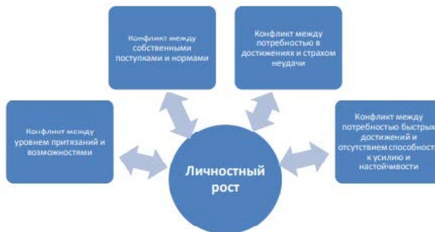
Рисунок 1 – Взаимосвязи между компонентом психологического благополучия «Личностный рост» и типами внутриличностных конфликтов

Иллюстрации могут иметь наименование и пояснительные данные (подрисуночный текст). Наименование помещают под иллюстрацией и пояснительными данными (выравнивают по левому краю, сохраняя отступ абзаца, между наименованием рисунка и основным текстом делается интервал на ширину строки) и формулируют, например, следующим образом: