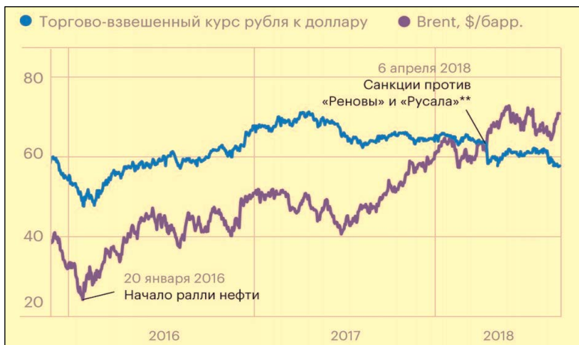
Рисунок 2 - Динамика курса рубля и цен на нефть марки Brent, 2016-2018 (Источники: Bloomberg; РБК 1 )

Таблицы применяют для характеристики точных данных, лучшей наглядности и удобства сравнения показателей, а также сопоставимости информации, полученной из разных источников.