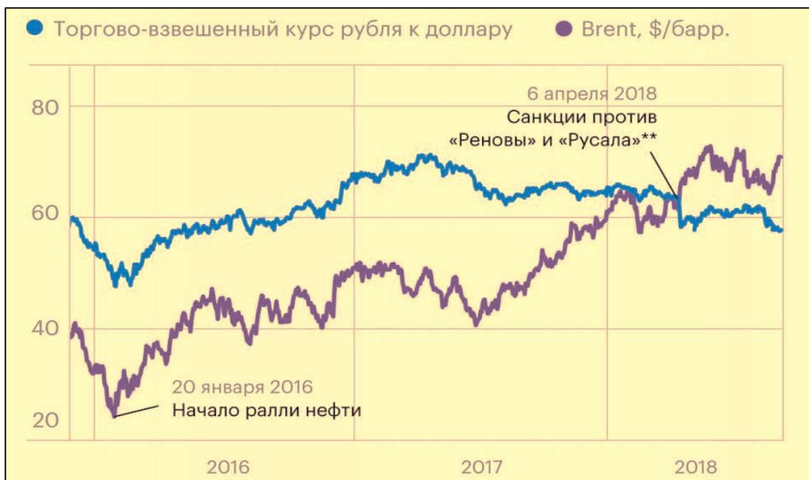
Рисунок 2 - Динамика курса рубля и цен на нефть марки Brent, 2016-2018 (Источники: Bloomberg; РБК 1 )

Таблицы применяют для характеристики точных данных, лучшей наглядности и удобства сравнения показателей, а также сопоставимости информации, полученной из разных источников.