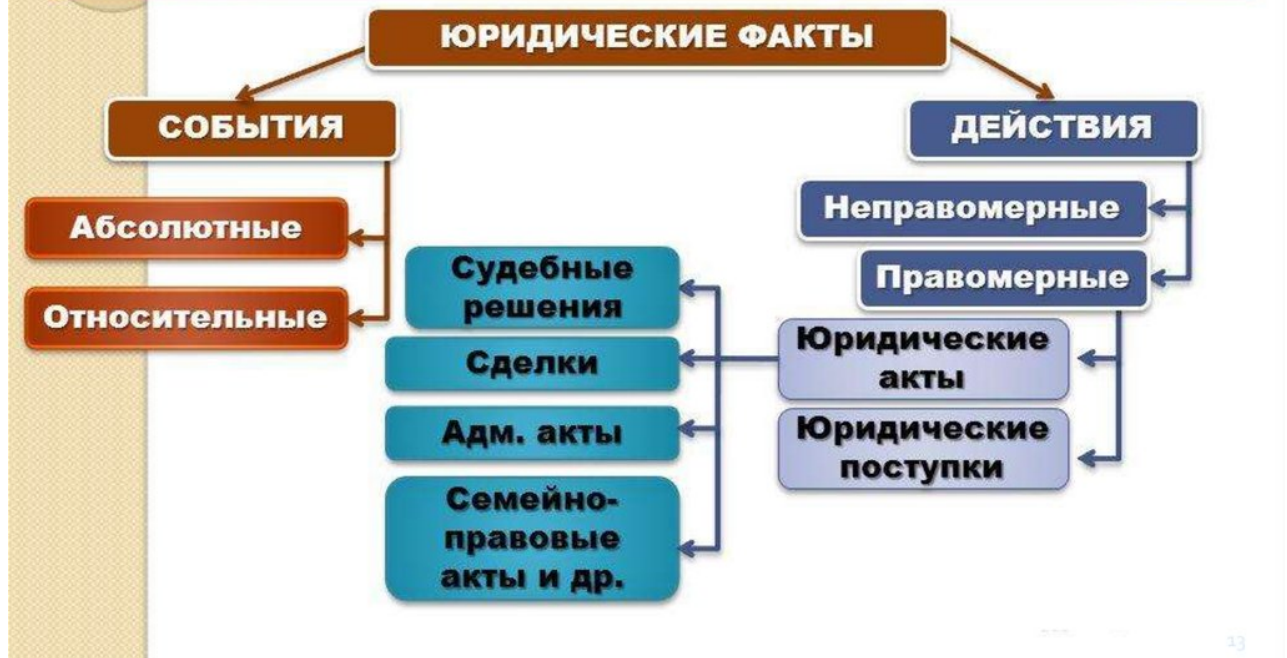
Рисунок 1 – Юридические факты

ЮРИДИЧЕСКИЕ ФАКТЫ – факты реальной действительности, с которыми действующие законы и иные правовые акты связывают возникновение, изменение или прекращение гражданских прав и обязанностей, т.е. правоотношений