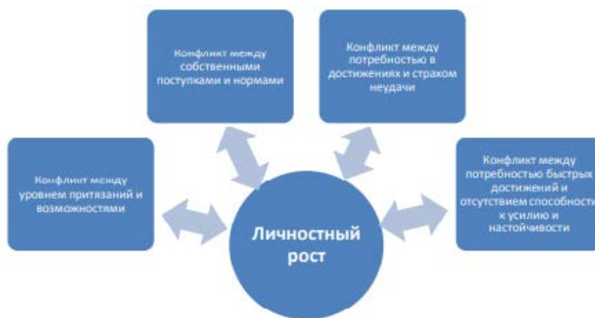
Рисунок 1 – Взаимосвязи между компонентом психологического благополучия «Личностный рост» и типами внутриличностных конфликтов

В конце наименования иллюстрации точку не ставят, но обязательно указывают источник, если иллюстрация заимствована, не принадлежит автору курсовой работы.