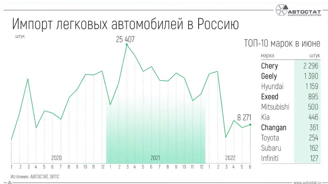
Рис. 2 – Импорт легковых автомобилей в Россию

В качестве иллюстративного материала в работах часто используются графики. График целесообразно использовать для характеристики и прогнозирования динамики непрерывно меняющегося показателя при наличии функциональной связи между фактором и показателем. Оси абсцисс и ординат должны иметь условные обозначения и размерность применяемых величин. Надписи, относящиеся к кривым и точкам, производят только в тех случаях, когда их немного и они кратки. Многословные надписи заменяют цифрами, расшифровка которых приводится в пояснительных данных. На одном графике не следует приводить больше трёх кривых.