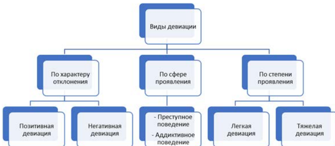
Рисунок 3 - Виды девиации по различным критериям 3

В качестве иллюстративного материала в работах часто используются диаграммы и графики. График целесообразно использовать, когда необходимо показать изменение во времени (до/после, этапы, возраст). Оси абсцисс и ординат в графике должны иметь условные обозначения и размерность применяемых величин. Надписи, относящиеся к кривым и точкам, производят только в тех случаях, когда их немного и они кратки. Многословные надписи заменяют цифрами, расшифровка которых приводится в пояснительных данных. На одном графике не следует приводить больше трёх кривых. Круговую диаграмму удобно использовать, когда необходимо показать состав выборки (доли), для сравнения групп (эксперимент/контроль, пол, профессия) удобнее использовать столбчатую диаграмму.