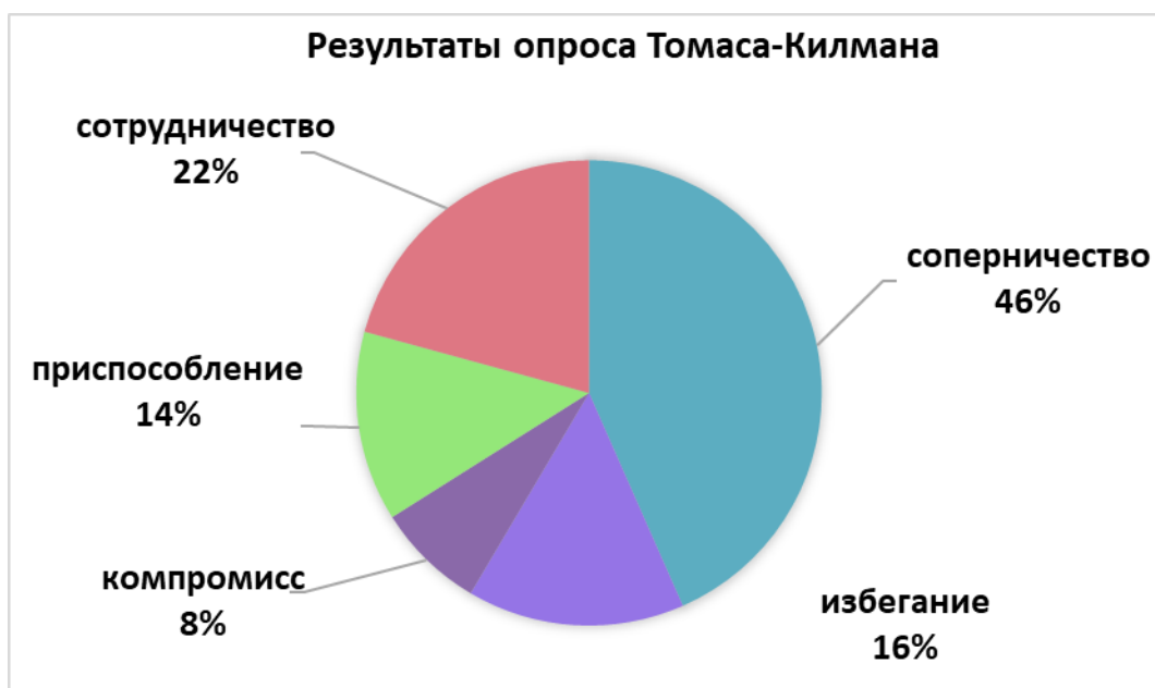
Рисунок 3 - Результаты опроса Томаса-Килмана среди всех обучающихся 4

В качестве иллюстративного материала в работах часто используются диаграммы и графики. График целесообразно использовать, когда необходимо показать изменение во времени (до/после, этапы, возраст). Оси абсцисс и ординат в графике должны иметь условные обозначения и размерность применяемых величин. Надписи, относящиеся к кривым и точкам, производят только в тех случаях, когда их немного и они кратки. Многословные надписи заменяют цифрами, расшифровка которых приводится в пояснительных данных. На одном графике не следует приводить больше трёх кривых. Круговую диаграмму удобно использовать, когда необходимо показать состав выборки (доли), для сравнения групп (эксперимент/контроль, пол, профессия) удобнее использовать столбчатую диаграмму.