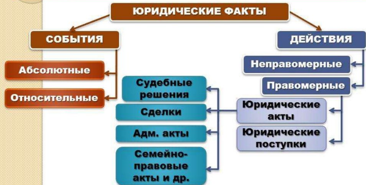
Рисунок 1 – Юридические факты

ЮРИДИЧЕСКИЕ ФАКТЫ – факты реальной действительности, с которыми действующие законы и иные правовые акты связывают возникновение, изменение или прекращение гражданских прав и обязанностей, т.е. правоотношений