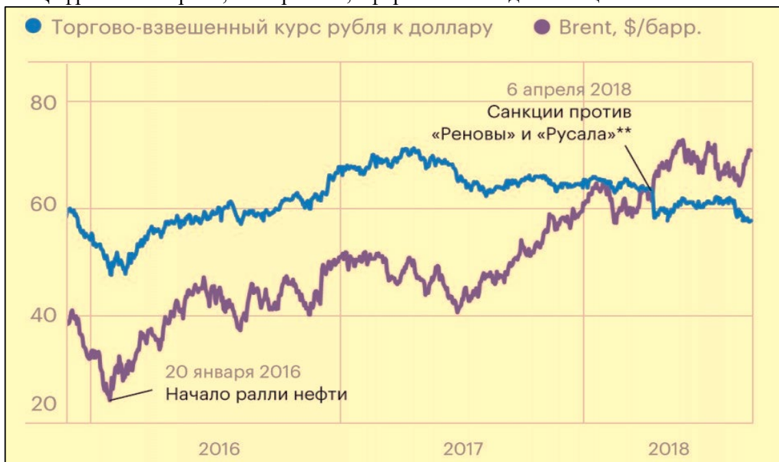
Рисунок 2 - Динамика курса рубля и цен на нефть марки Brent, 2016-2018 (Источники: Bloomberg; РБК 2 )

Цифровой материал, как правило, оформляют в виде таблиц.