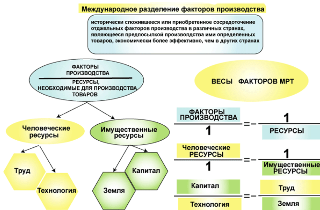
Рисунок 1 – Сущность международного разделения труда и факторы, его определяющие

Иллюстрации могут иметь наименование и пояснительные данные (подрисуночный текст). Наименование помещают под иллюстрацией и пояснительными данными (выравнивают по левому краю, сохраняя отступ абзаца) и формулируют, например, следующим образом: