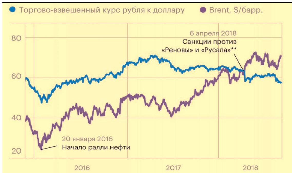
Рисунок 2 - Динамика курса рубля и цен на нефть марки Brent, 2016-2018 (Источники: Bloomberg; РБК 1 )

Таблицы применяют для характеристики точных данных, лучшей наглядности и удобства сравнения показателей, а также сопоставимости информации, полученной из разных источников.