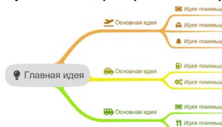
Рис.1 Пример создания карты

Для обработки и решения полученных от руководства компании профессиональных задач с применением программных средств, на сайте mind-map-online.ru , используя инструменты mind-map , создайте карту организации путешествия, пример создания карты см. рис.1.