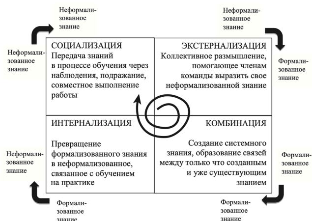
Рис. Спираль знания

Определите альтернативные издержки обучения на кулинарных курсах, если работа курьера принесет доход 7000 руб. Затраты обучения на курсах включают в себя: плату за обучение – 2500 руб., расходы на транспорт 1000 руб., расходы на питание 1500 руб.