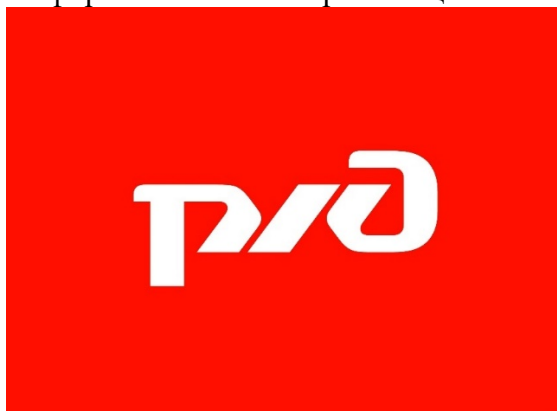
Рис. 1. Логотип РЖД

Задание 1. Проанализируйте корпоративный имидж РЖД (рис. 1). Назовите преимущества и недостатки фирменного стиля организации.