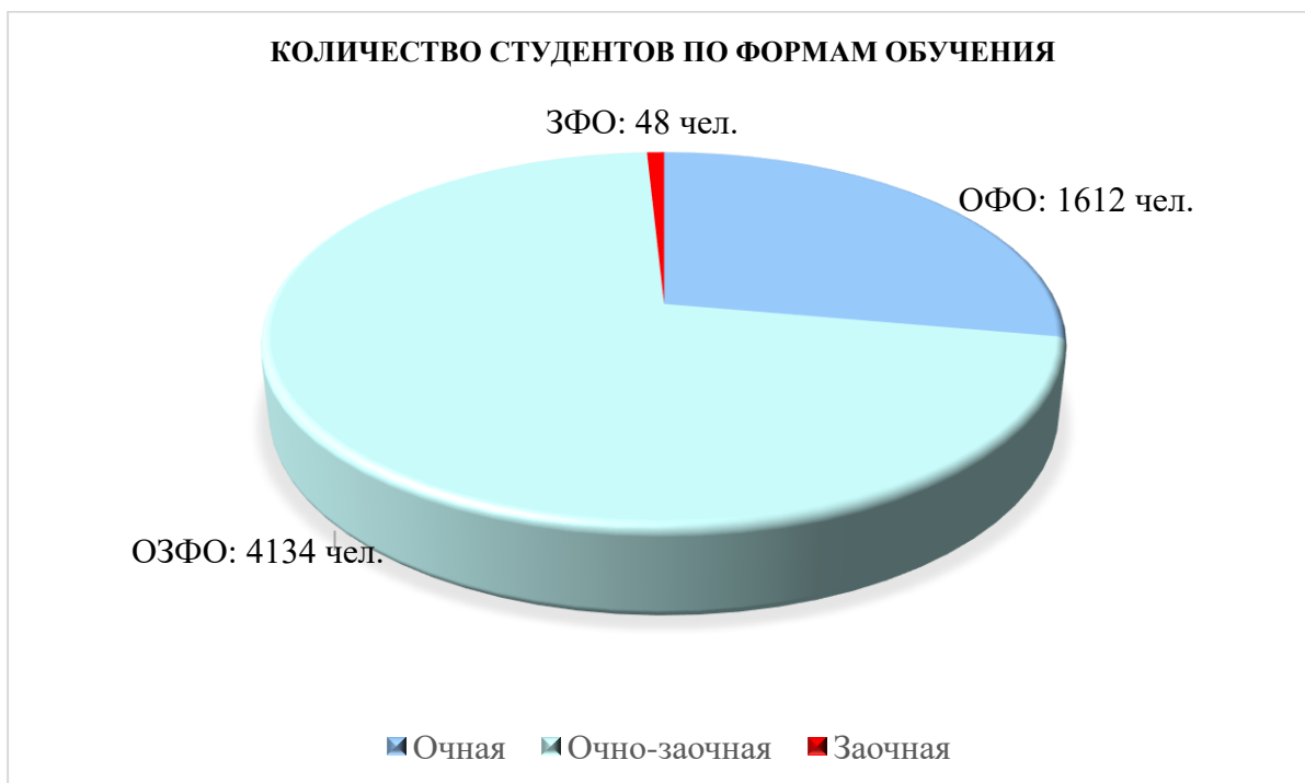
Рисунок 1. Количество студентов по формам обучения