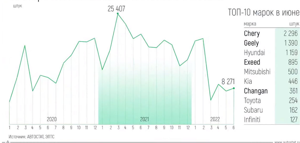
Рис. 2 – Импорт легковых автомобилей в Россию

Цифровой или иной материал, как правило, оформляют в виде таблиц. Таблицы применяют для характеристики точных данных, лучшей наглядности и удобства сравнения показателей, а также сопоставимости информации, полученной из разных источников. Нумерация таблиц также должна быть сквозной по тексту курсовой работы. Слова «Таблица» и номер таблицы, например «Таблица 1» выравнивают по левому краю без точки. Название таблицы размещают на следующей строке и выравнивают по центру. Название таблицы должно отражать его содержание, быть точным и кратким.