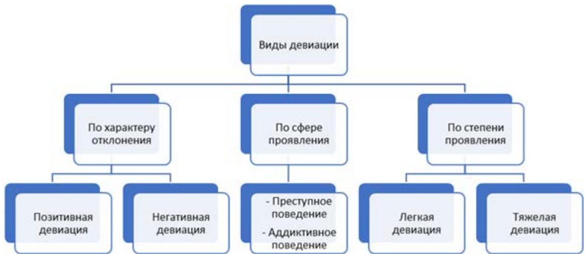
Рисунок 3 - Виды девиации по различным критериям 3

В качестве иллюстративного материала в работах часто используются диаграммы и графики. График целесообразно использовать, когда необходимо показать изменение во времени (до/после, этапы, возраст). Оси абсцисс и ординат в графике должны иметь условные обозначения и размерность применяемых величин. Надписи, относящиеся к кривым и точкам, производят только в тех случаях, когда их немного и они кратки. Многословные надписи заменяют цифрами, расшифровка которых приводится в пояснительных данных. На одном графике не следует приводить больше трёх кривых. Круговую диаграмму удобно использовать, когда необходимо показать состав выборки (доли), для сравнения групп (эксперимент/контроль, пол, профессия) удобнее использовать столбчатую диаграмму.