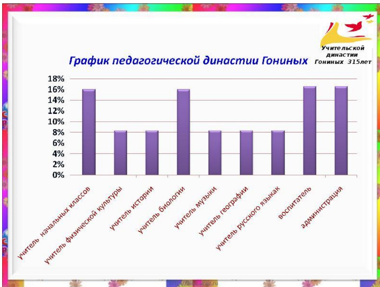
Рис. 2 – График педагогической династии Гониных

случаях, когда их немного и они кратки. Многословные надписи заменяют цифрами, расшифровка которых приводится в пояснительных данных. На одном графике не следует приводить больше трёх кривых.