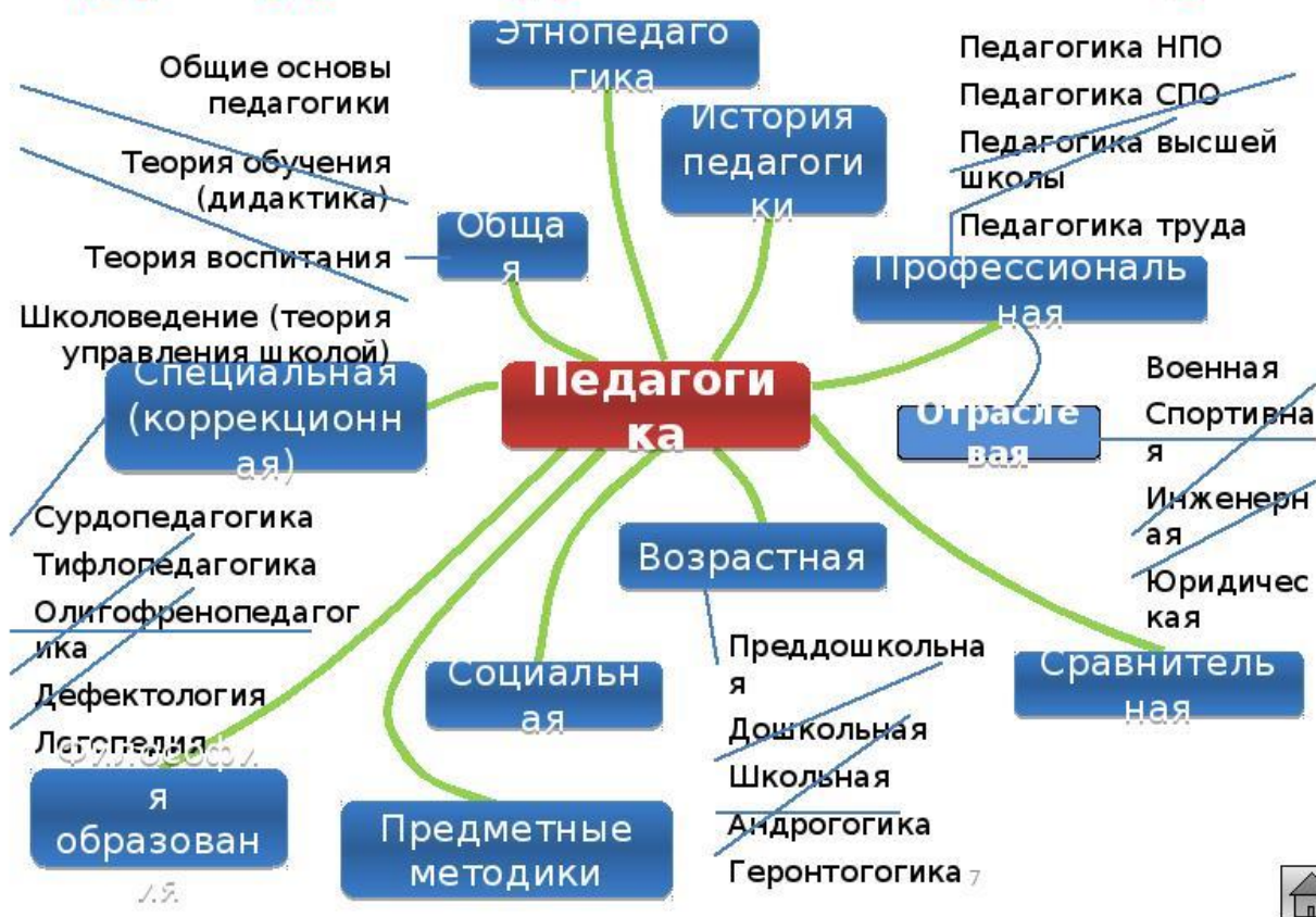
Рис. 1 – Структура педагогической науки

В конце наименования иллюстрации точку не ставят, но обязательно указывают источник, если иллюстрация заимствована, не принадлежит автору курсовой работы. Иллюстрации следует располагать по тексту ближе к первому упоминанию. Значительные по размеру и объему данных иллюстрации лучше выносить в приложения к работе. На весь иллюстрационный материал должны быть ссылки в тексте; например: «... как это представлено на рис. 2».