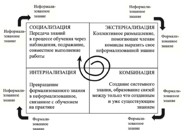
Рис. Спираль знания

Задание 4. В рамках реализации «Спирали знаний», применяя комбинацию «Интернализация» (рис.), предполагающую превращение формального знания в неформальное, связанное с обучением на практике, студенты решили поработать и оценить возможности интеллектуального капитала и знаний для развития бизнеса. Во время летних каникул можно будет заработать, выполняя работу курьера, или устроиться ассистентом повара на кулинарные курсы.