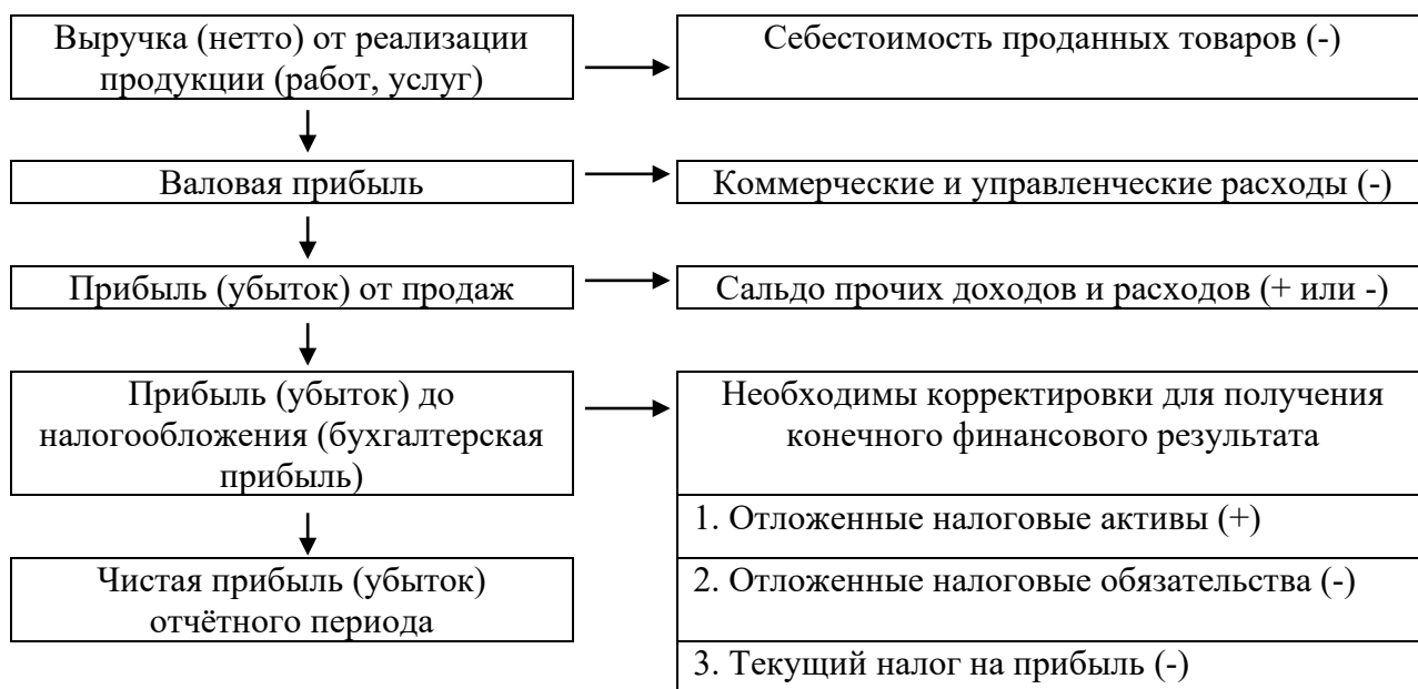
Рисунок 2 - Формирование конечного финансового результата предприятия в форме чистой прибыли (убытка) отчётного периода 2

Иллюстрации следуют располагать по тексту ближе к первому упоминанию. Значительные по размеру и объёму данных иллюстрации лучше выносить в приложения к работе. На весь иллюстрационный материал должны быть ссылки в тексте; например, «... как это представлено на рисунке 2». Если наименование рисунка состоит из нескольких строк, то его следует записывать через один межстрочный интервал.