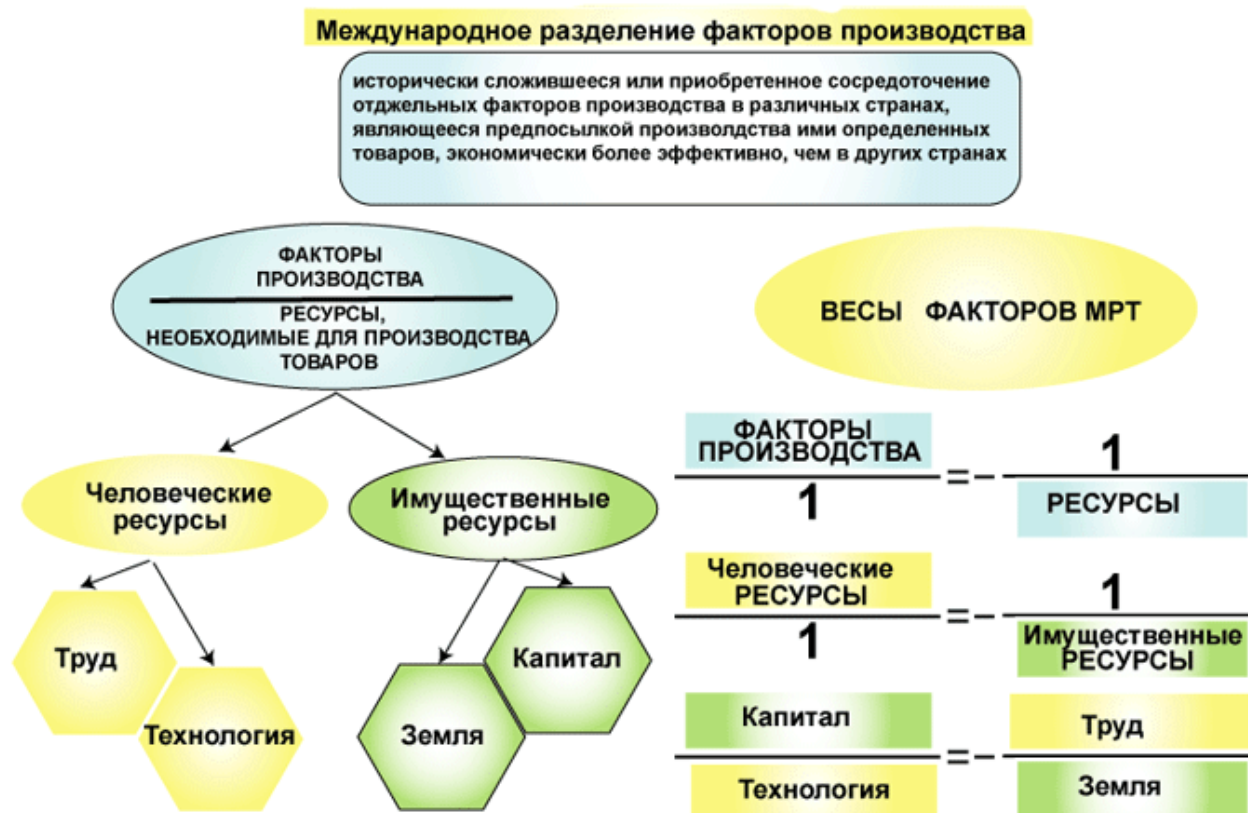
Рисунок 1 – Сущность международного разделения труда и факторы, его определяющие

Иллюстрации могут иметь наименование и пояснительные данные (подрисуночный текст). Наименование помещают под иллюстрацией и пояснительными данными (выравнивают по левому краю, сохраняя отступ абзаца) и формулируют, например, следующим образом: