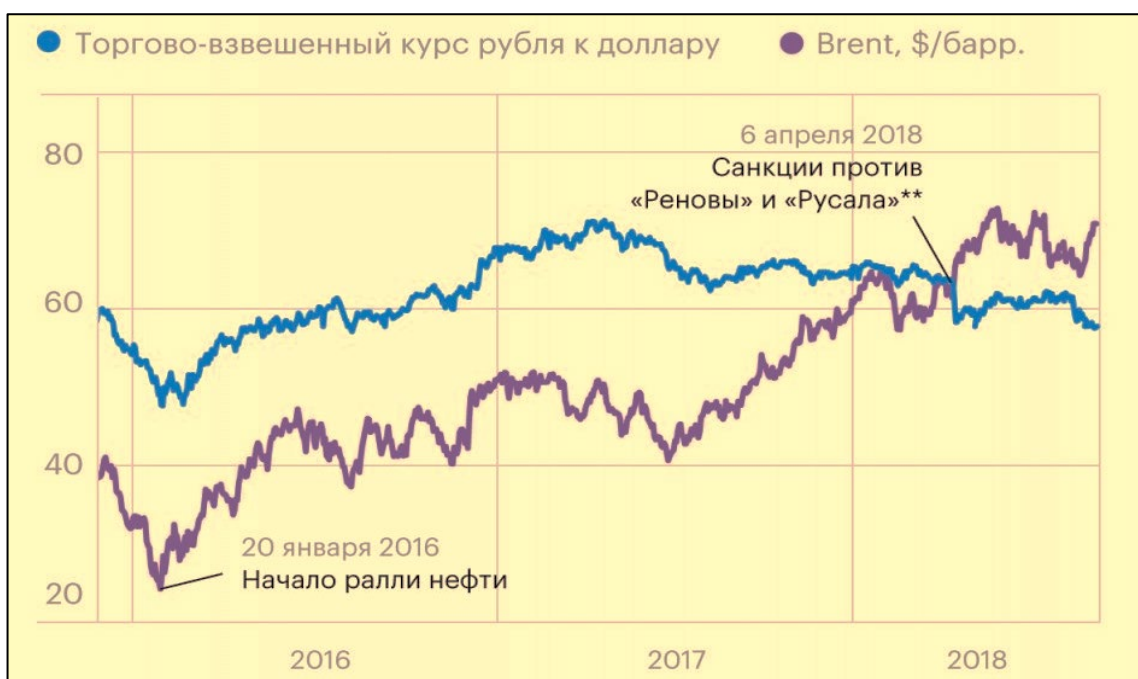
Рисунок 2 - Динамика курса рубля и цен на нефть марки Brent, 2016-2018

Цифровой материал, как правило, оформляют в виде таблиц.