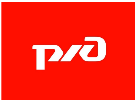
Рис. 1. Логотип РЖД

Задание 1. Проанализируйте корпоративный имидж РЖД (рис. 1). Назовите преимущества и недостатки фирменного стиля организации.