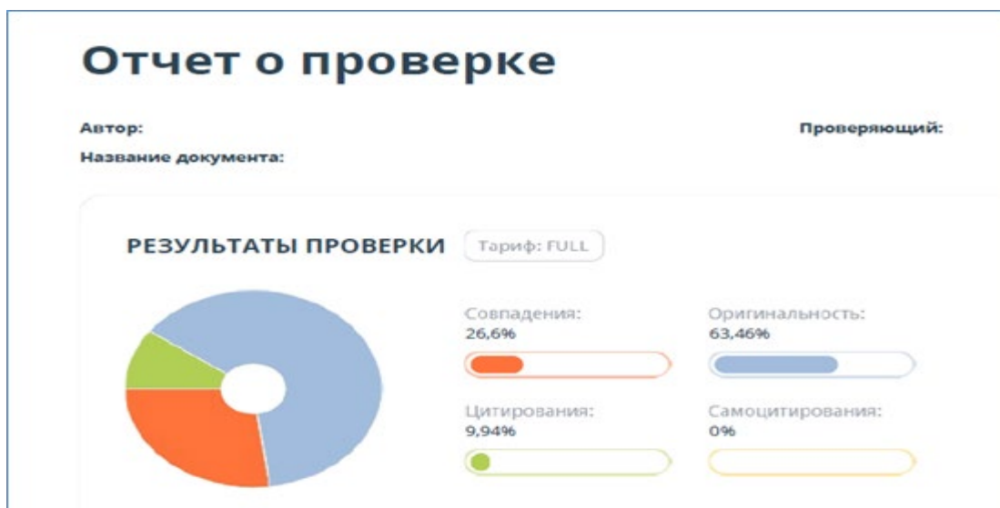
Рисунок 1 – Пример отчёта о проверке

Руководитель ВКР оставляет за собой право перепроверки отчета на заимствования.