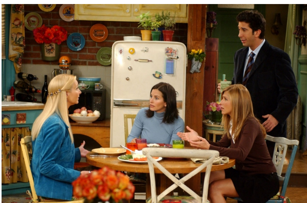
Рис. 2 – Изображение из сериала «Друзья»