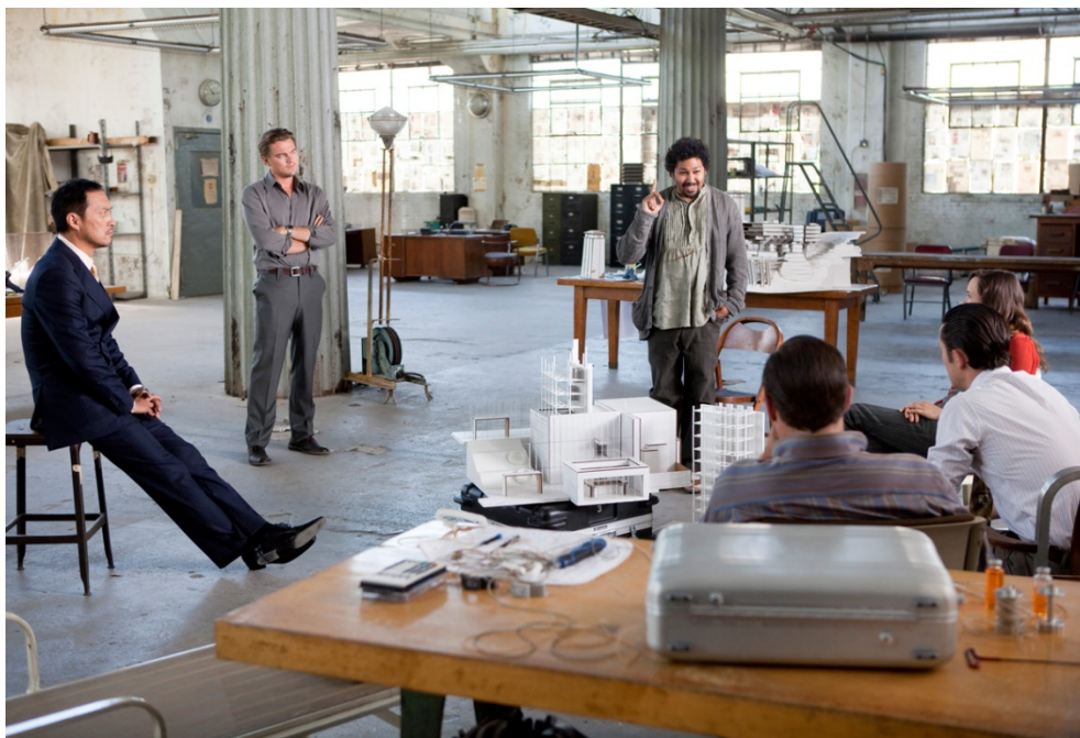
Рис. 1 – Изображение из фильма «Начало»

Задание 2. Ознакомьтесь с изображениями. Какие рекламные бренды можно использовать в данном моменте. Какие вербальные и невербальные инструменты проактивного продаж можно использовать? Стоит ли называть торговые марки? Насколько использование данной рекламы соответствует этике рекламы и закону «О рекламе»? Ответ аргументируйте.