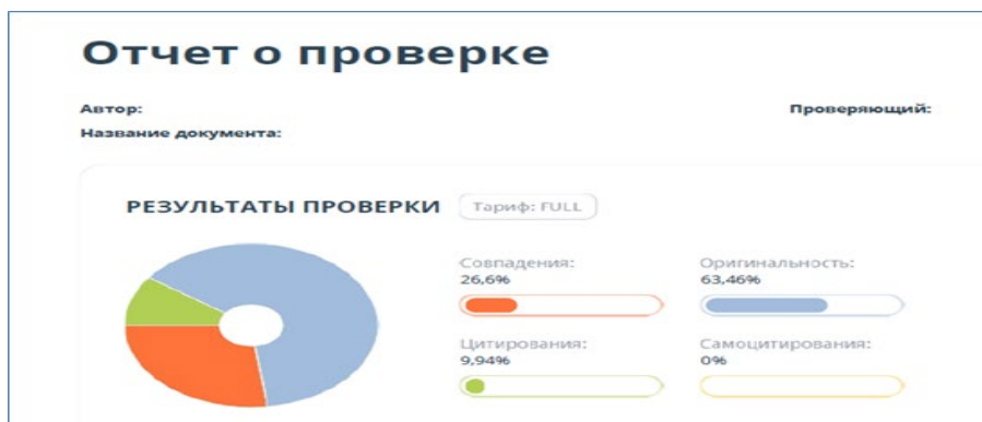
Рисунок 1 – Пример отчёта о проверке

Руководитель ВКР оставляет за собой право перепроверки отчета на заимствования.