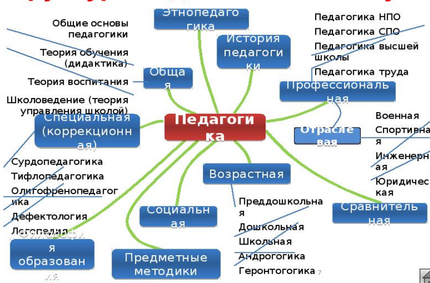
Рис. 1 – Структура педагогической науки

В конце наименования иллюстрации точку не ставят, но обязательно указывают источник, если иллюстрация заимствована, не принадлежит автору выпускной квалификационной работы.