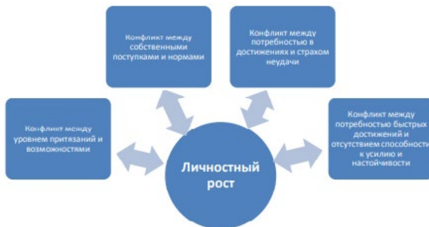
Рисунок 1 – Взаимосвязи между компонентом психологического благополучия «Личностный рост» и типами внутриличностных конфликтов

Иллюстрации могут иметь наименование и пояснительные данные (подрисуночный текст). Наименование помещают под иллюстрацией и пояснительными данными (выравнивают по левому краю, сохраняя отступ абзаца, между наименованием рисунка и основным текстом делается интервал на ширину строки) и формулируют, например, следующим образом: